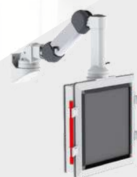
RAMIONA NOŚNE + PANELE HMI