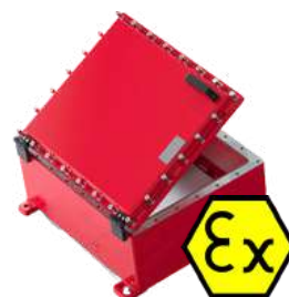
STREFA ZAGROŻONA WYBUCEM EX