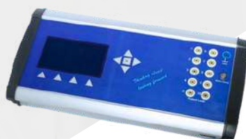
OBUDOWY DO ELEKTRONIKI